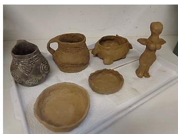
Pfahlbau Keramik und Küche

Von den 70 Förderprojekten wurden 21 Maßnahmen als Kleinprojekte (Gesamtkosten < 5.700 Euro) von gemeinnützigen Vereinen auf unkomplizierte Weise (zB kein Rechnungsnachweis nötig) mit einer 80%-Pauschalförderung umgesetzt. Das Motto: „Klein aber fein“.