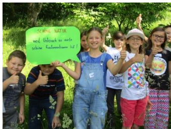
Kinder.Leben in Unterach