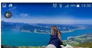
Weitwandern am Attersee - Aufi. Owi. Umi.

Projekträger: Tourismusverband Attersee - Salzkammergut