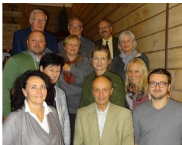
Projektauswahlgremium der REGATTA

Der Regionalentwicklungsverein Attersee-Attergau, die REGATTA, hat in 5 Fördersitzungen seit Juli 2015 insgesamt 1,17 Mio. Euro für 30 Projekte genehmigt. Jedes Projekt wird anhand von 16 Qualitätskriterien objektiv bewertet und muss im Durchschnitt mindestens 19 Punkte erhalten. Erst dann wird über die Zuteilung einer LEADER-Förderung abgestimmt. Aus den 12 REGATTA- Gemeinden wählt je 1 Vorstandsmitglied die LEADER-Förderprojekte aus.